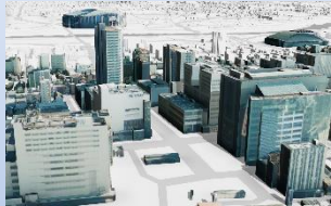
豊田市駅周辺 3D都市モデルPLATEAU (7フラトー)

豊田市ではこれまで特に建設分野で道路（2,600km）や市内の3次元の「まちのデータ」取得に取り組んできました。取得したデータは降雨や洪水による市内の浸水範囲や水位の可視化、交差点改良時のシミュレーション（事前検証）などに活用しています。 様々な利活用の可能性が見込まれる3次元データの活用について今後の利活用促進に向けた取組について質問と提案をさせていただきました。 提案としては、現在進められている豊田市駅周辺整備でのバス降車場や駅前広場整備の設計・検討、市役所など公共施設窓口の混雑回避に向けたレイアウトなどの事前検討時のデジタルツインシミュレーションの活用を訴えました。 執行部からは今後の整備事業での活用を検討していくと答弁いただきました。